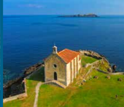
Santa Katalina ermita Ermita de Santa Catalina