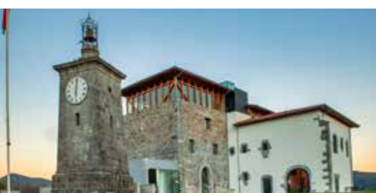
Gernika-Lumo 12,9 km / 19 min.