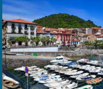
Portua El puerto