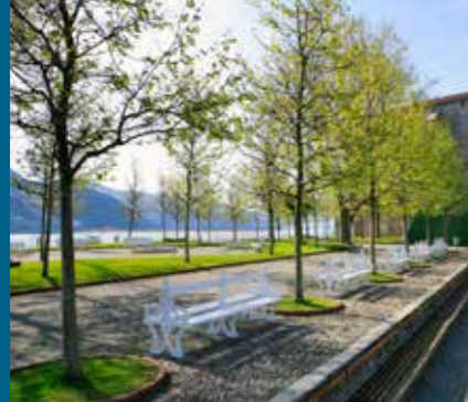
Talako begiratokia El mirador de la Atalaya