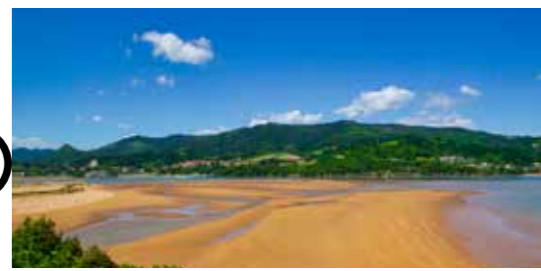
Laga (Ibarrangelu) 27,9 km / 39 min.