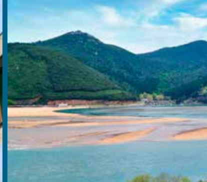
Portuondoko begiratokia El Mirador de Portuondo