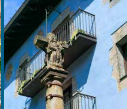
Kalbarioko gurutzeta La Cruz del Calvario