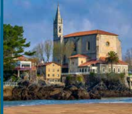
Andra Mari eleiza Iglesia de Santa María