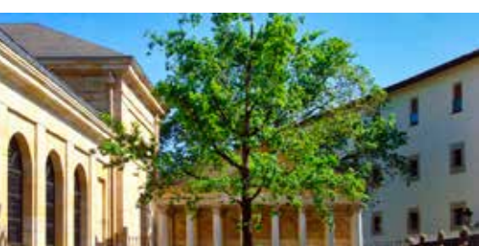
Bermeo 3,1 km / 6 min.